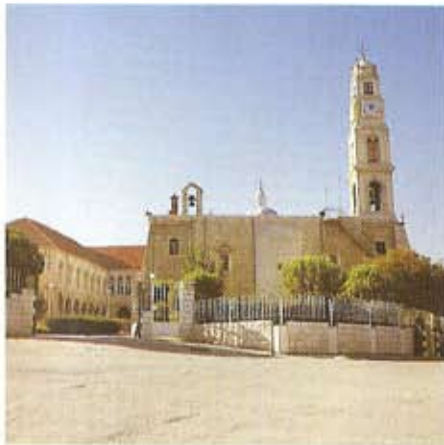
El monasterio de Nuestra Señora de Salvación (Saidet an-Nayat)