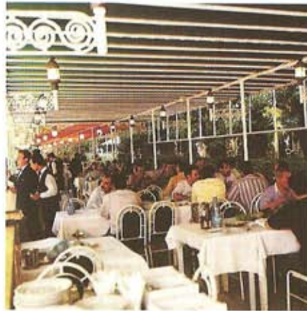
Restaurante en Bardawni

su acento particular. En cuanto a la reputación intelectual de la ciudad, responde a una larga alcurnia de poetas, pensadores y escritores que han contribuido al desarrollo cultural del Líbano, en su totalidad.